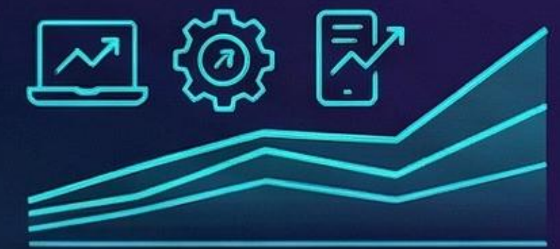
急速なDXニーズの増大