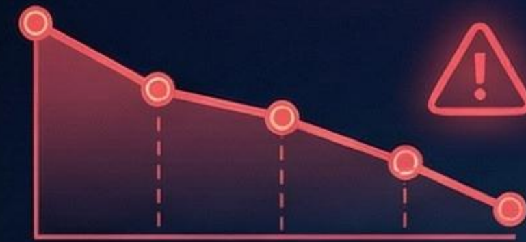
日本の労働力人口減少 (declining stats from data)

人は足りないが、仕事は増えている。この矛盾を解消するのが、AIエージェントによる「人間の分身」の派遣です。AIが自律的に業務を遂行し、深刻な労働力補完を実現します。